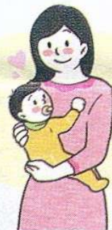
[ 임신/출산 ]