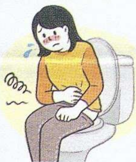
[ 변비 ]