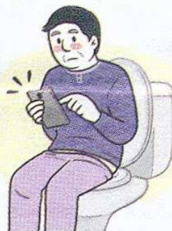
[ 배변습관 ]