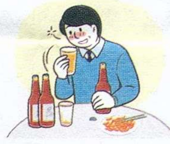
[ 음주 ]

치질은 변비나 화장실에 오래 앉아있는 습관, 임신/출산, 지나친 음주 등 항문 주위 혈관을 늘어나게 하는 다양한 요인에 의해 발생·악화되므로 주의하는 것이 좋습니다.